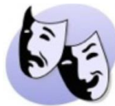
сохранение культурного наследия