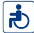
социальная помощь нуждающимся