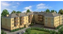
группа жилых домов