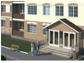
подъезд многоквартирного жилого дома