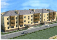
многоквартирный жилой дом