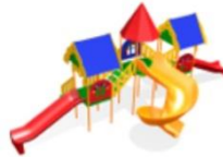
детские и спортивные площадки